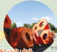
サクラの 森の遊具