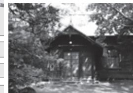
※旧永山武四郎邸 北海道開拓に尽力した永山武四郎が住む邸宅として、明治時代に建設。現在は、札幌市が邸宅の周辺をとりまく公園とともに管理しています。歴史的な建築として、北海道指定有形文化財に指定されています。