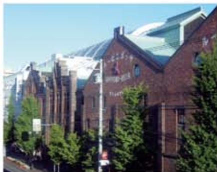
サッポロビール工場の建物をそのまま利用したサッポロ ファクトリー

まずは、「サッポロファクトリー」 にあるこちらから。明治9年 創業当時の味を再現した開拓 使地ビールを、なんと250円 で提供。240mlのミニサイズ なので、数種類の飲み比べを 楽しめます。店内はスタンディ ング。夏季は屋外にテーブル 席を用意しています。気軽に のぞける雰囲気も価格も嬉し い一軒です。